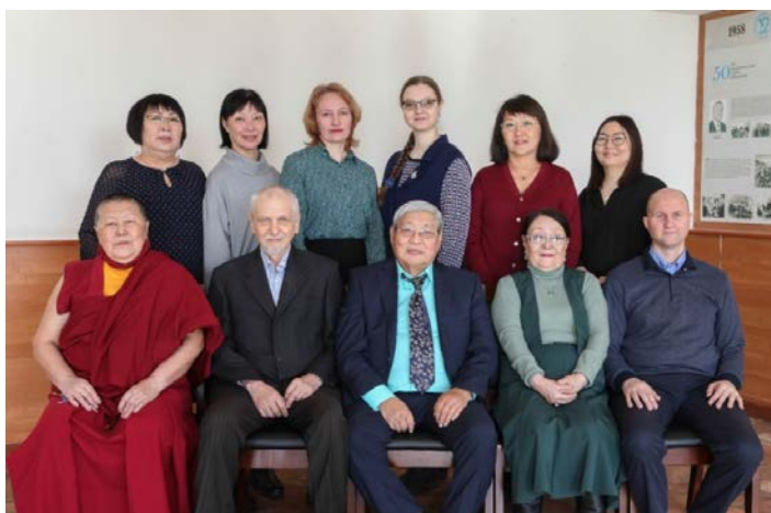
Отдел философии, культурологии и религиоведения ИМБТ СО РАН, 2022 г.